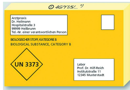
Beispiel einer Verpackung für UN 3373 – nur als Maxi-brief zugelassen, nicht als Großbrief oder Waren-sendung.

muss neben der Raute mit der UN 3373 die neue offizielle Benennung in deutscher und englischer Sprache tragen: „BIOLOGISCHER STOFF, KATEGORIE B“ und „BIOLOGICAL SUBSTANCE, CATEGORY B“. Im Absenderfeld wird die Telefonnummer einer verantwortlichen Person gefordert.